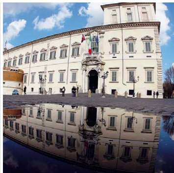
Incontro col Presidente In senso orario, il Quirinale, Giorgio Napolitano e Giovanni Ballarini.

vuti dal Presidente dello stato è certamente un onore - spiega Giovanni Ballarini - un riconoscimento che va a coronare i 60 anni di attività dell'Accademia italiana della cucina e un'ulteriore dimostrazione di quanto la buona tavola sia importante per la cultura e l'espressione del nostro Paese. L'Accademia italiana della cucina da sempre si pone l'obiettivo di divulgare la conoscenza e la tradizione dei piatti della nostra terra cercando di tutelarne l'autenticità che ci identifica nel resto del mondo». In apertura del libro, il Presidente della Repubblica scrive una nota di approvazione, riportando che il volume illustra, attraverso una suggestiva e ricca collezione di menu relativi ad attività istituzionali di rappresentanza del Quirinale, l'evoltersi, all'interno della cultura gastronomica e degli usi del protocollo ufficiale, della civiltà italiana della tavola. *